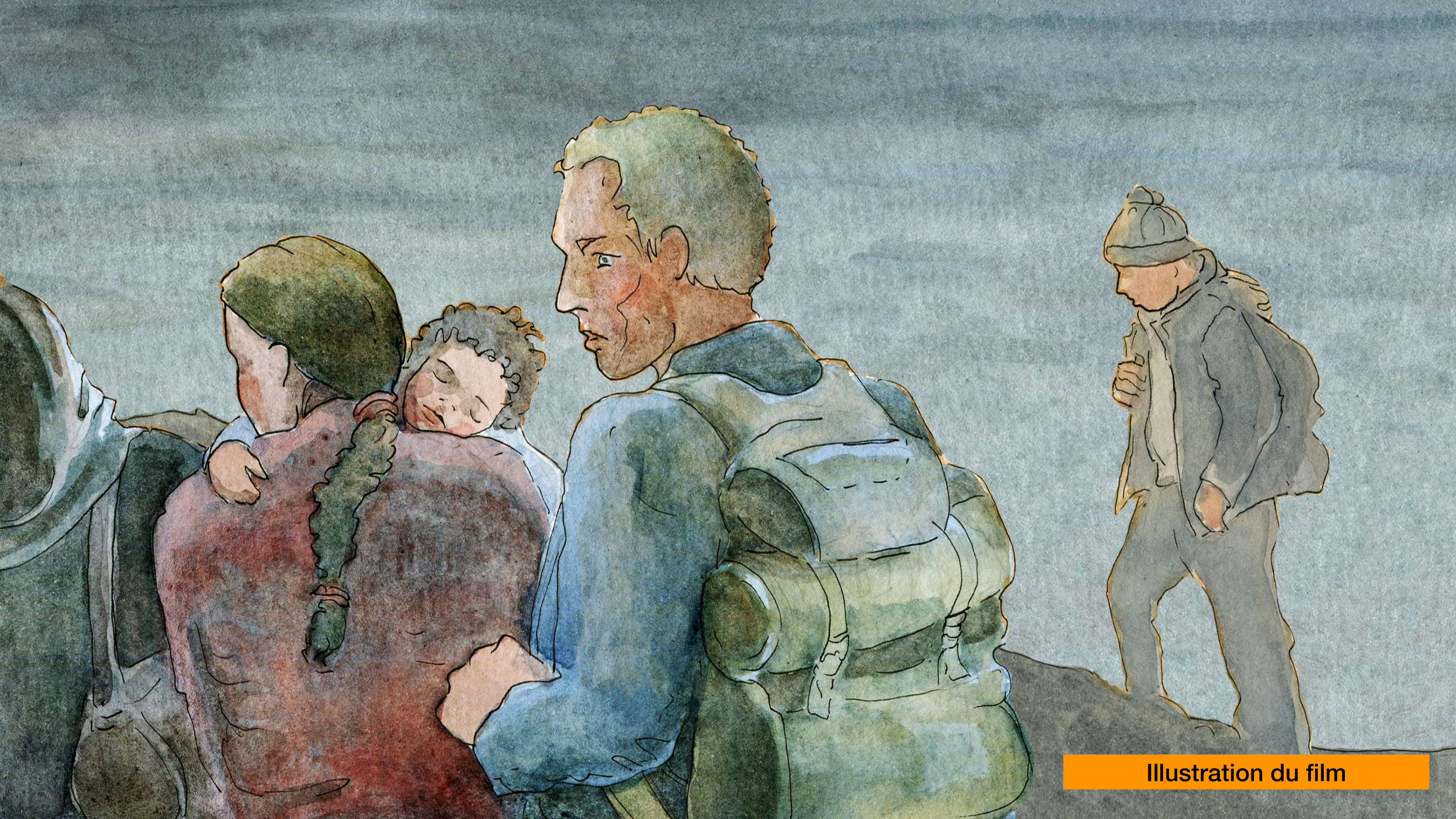
Illustration du film