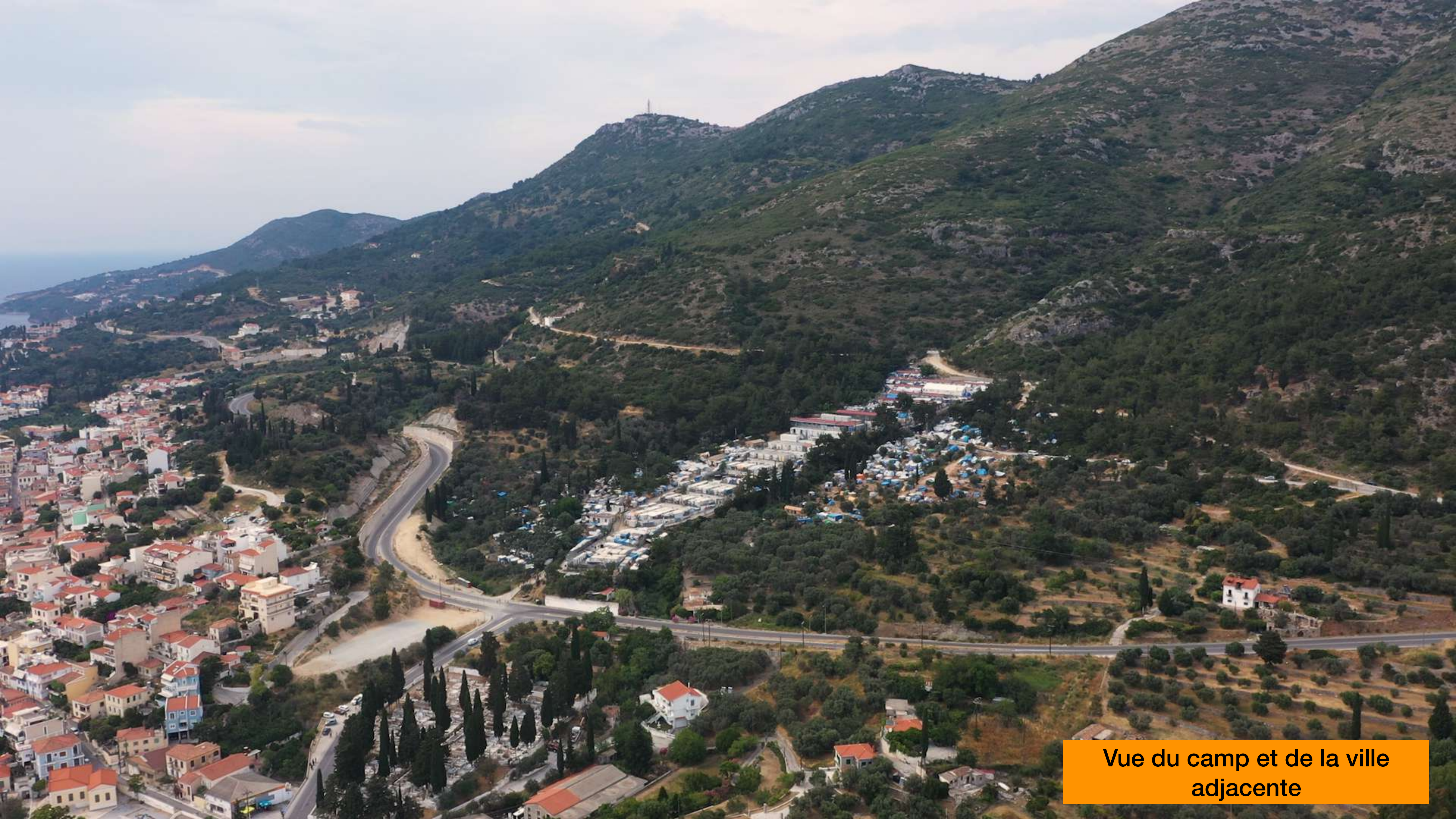
Vue du camp et de la ville adjacente